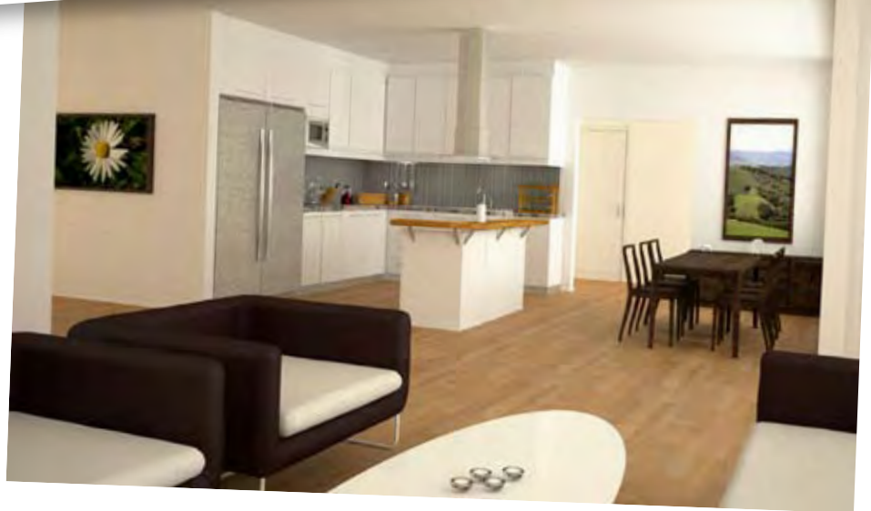
Öppen planlösning som skapar bra förutsättning för ett rikt sällskapsliv.