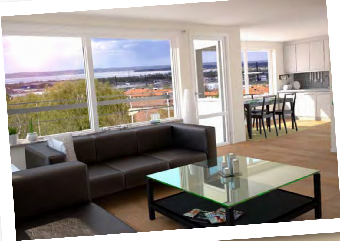
Tänkt vy från de övre planen med norrläge.